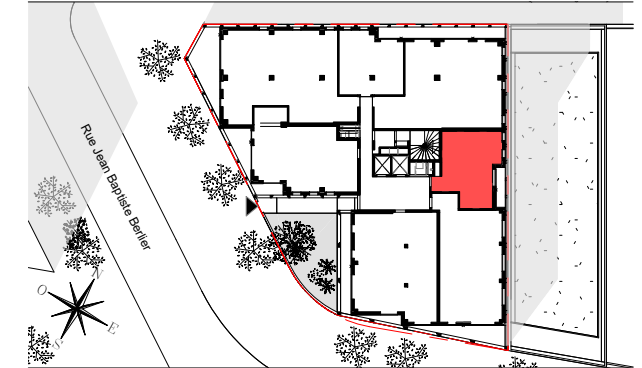
STUDIO ALCOVE n°1031 au 3ème étage